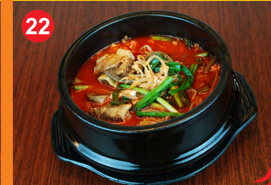
22 GALBI YUKGAEJANG 갈비육개장