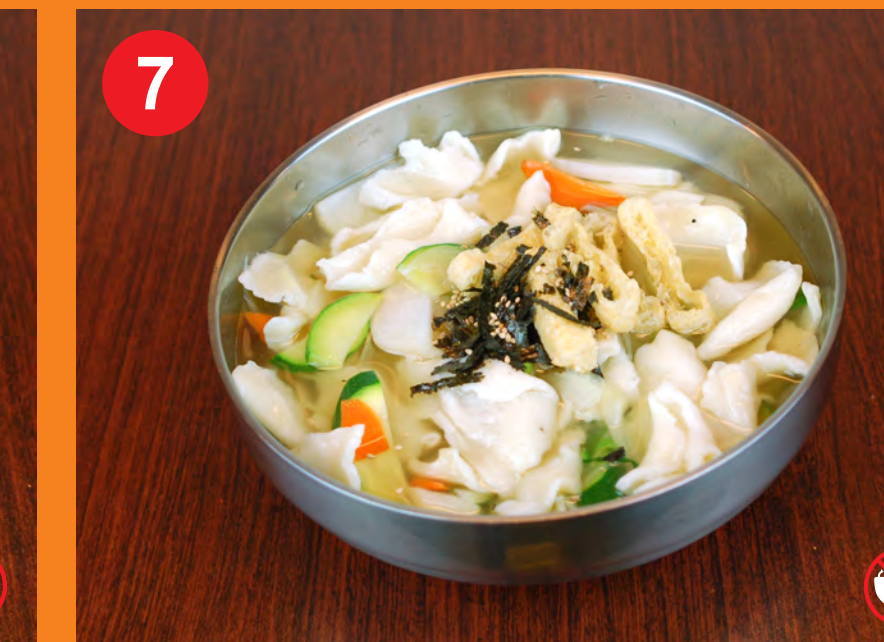
7 SUJEBI 수제비