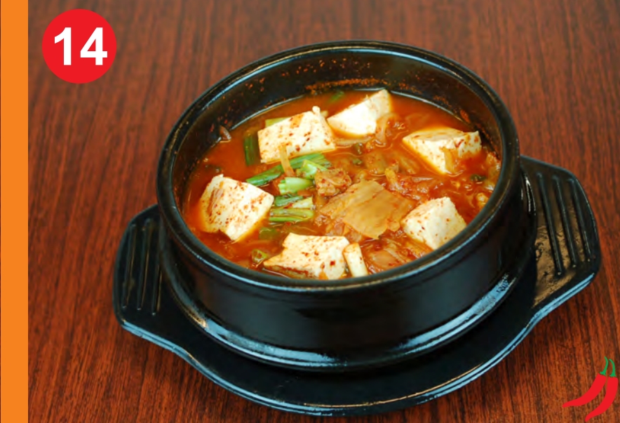
14 KIMCHI JJIGAE 김치찌개