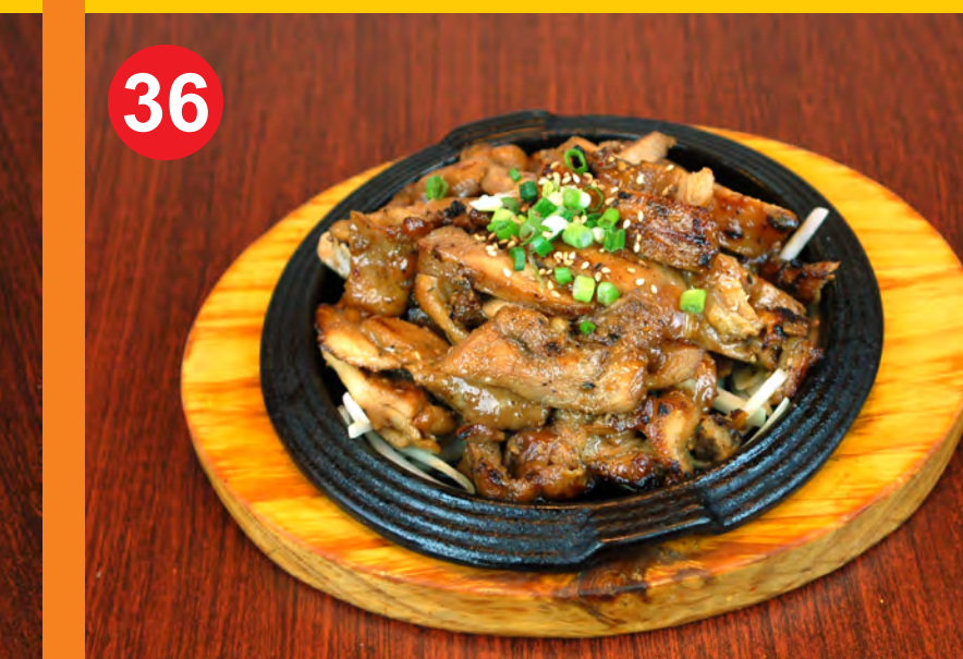
36 DAK BULGOGI 닭불고기