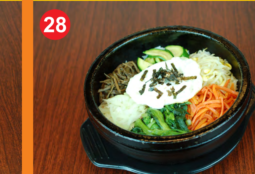
28 NAMUL DOLSOT BIBIMBAP 나물돌솥