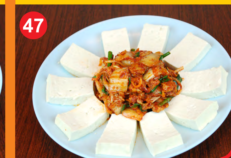
47 TOFU-KIMCHI 두부김치