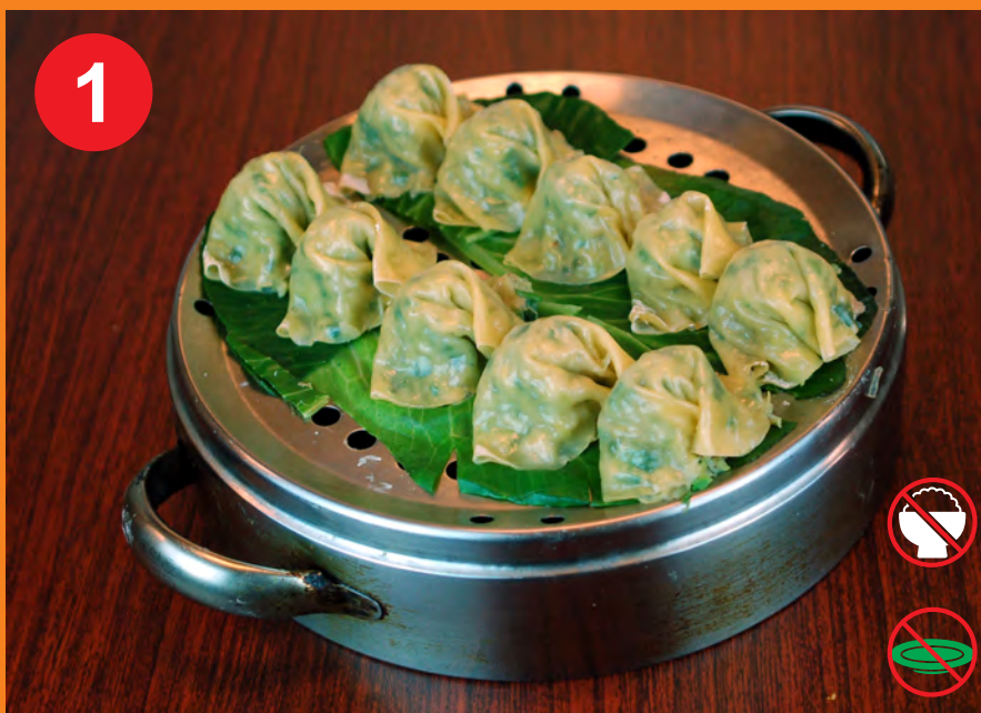
1 JJIN MANDU 찜만두