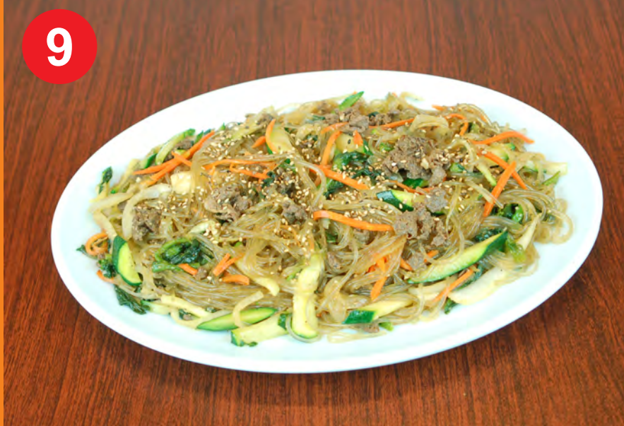
9 JABCHAE 잡채