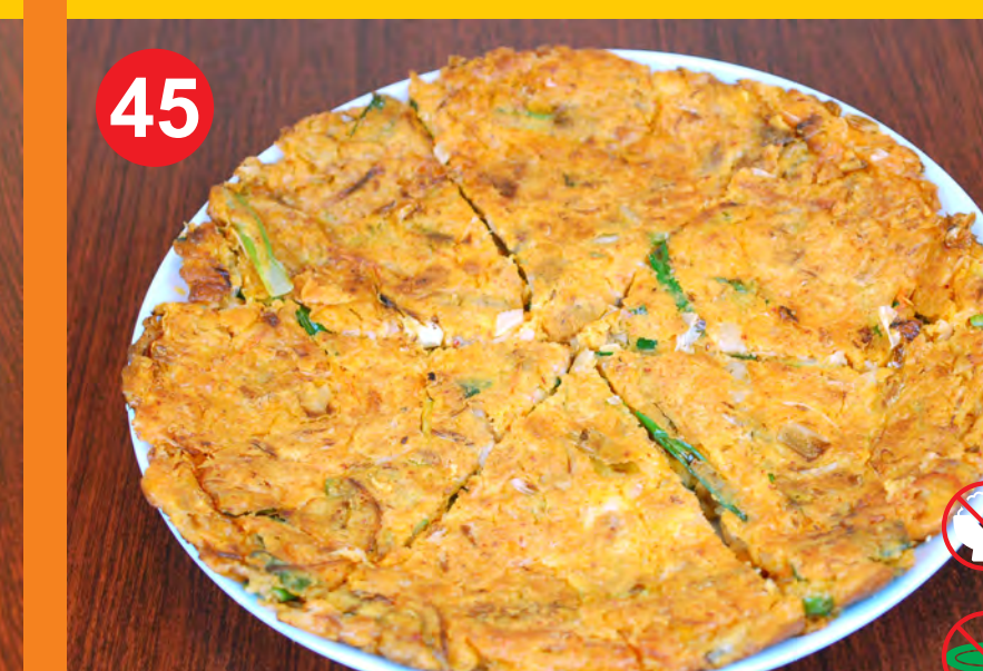
45 KIMCHI PAJEON 김치파전