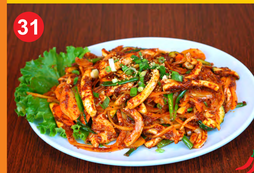
31 OJINGEO BOKKEUM 오징어볶음