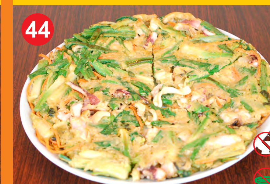
44 HAEMUL PAJEON 해물파전