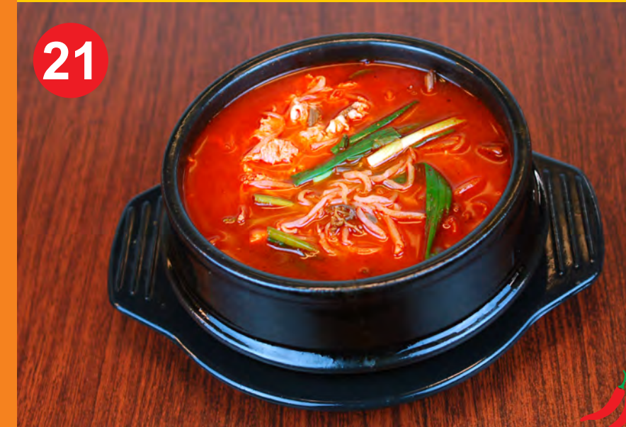
21 YUKGAEJANG 육개장