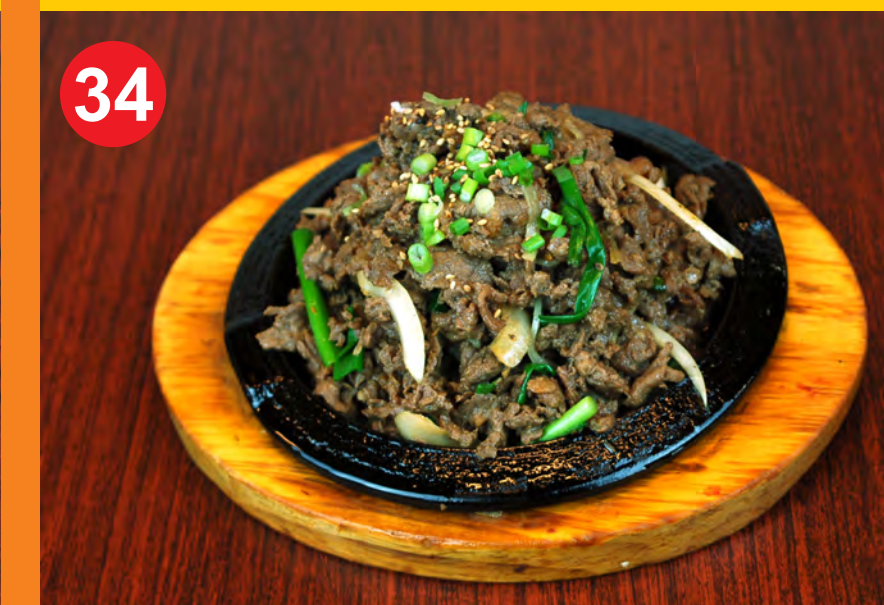
34 BULGOGI 불고기