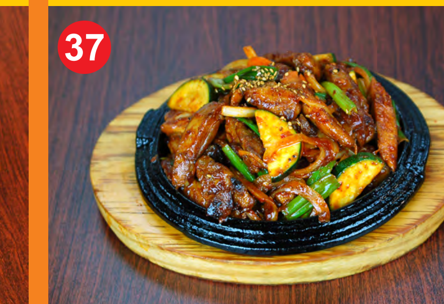
37 MAEWOON DAK BULGOGI 매운닭불고기