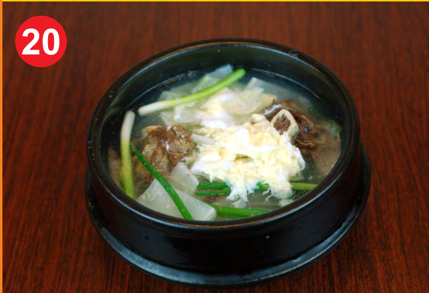
20 GALBI TANG 갈비탕