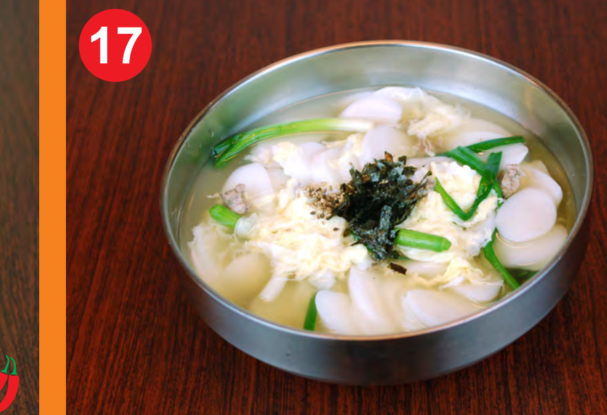
17 DDUK GUK 떡국