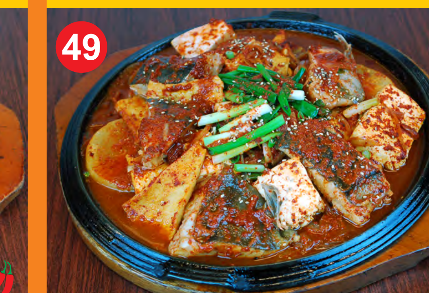
49 KWANGEO JORIM 광어목살조림