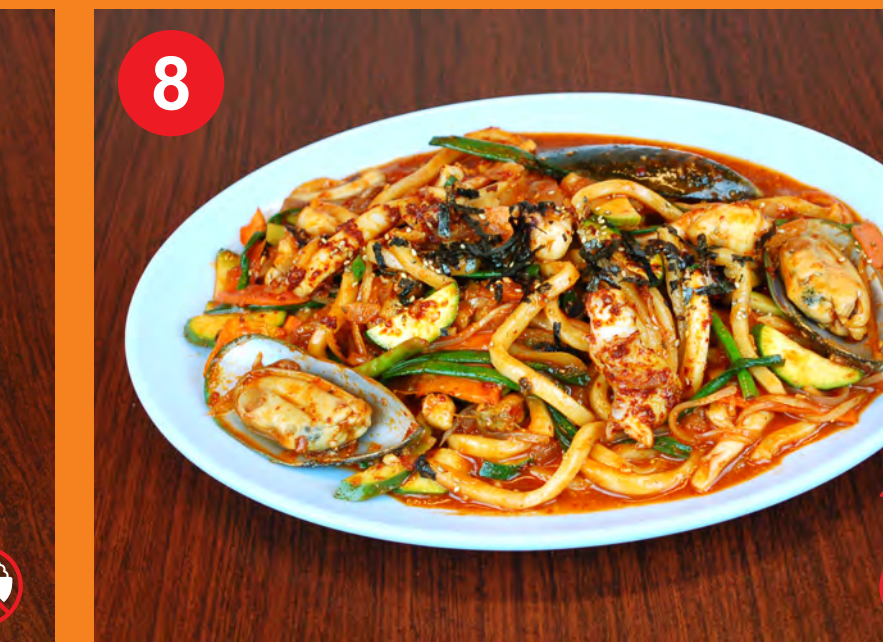
8 HAEMUL BOKKEUM UDON 해물볶음우동