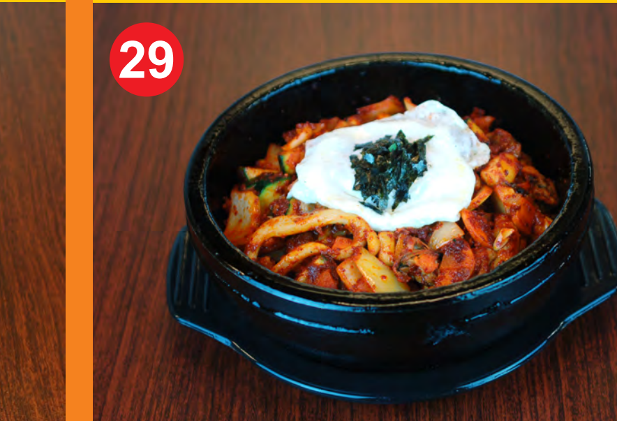
29 HAEMUL DOLSOT BIBIMBAP 해물돌솥