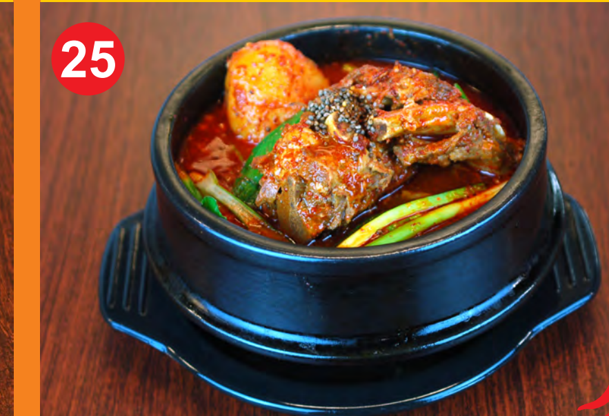
25 GAMJA TANG 감자탕