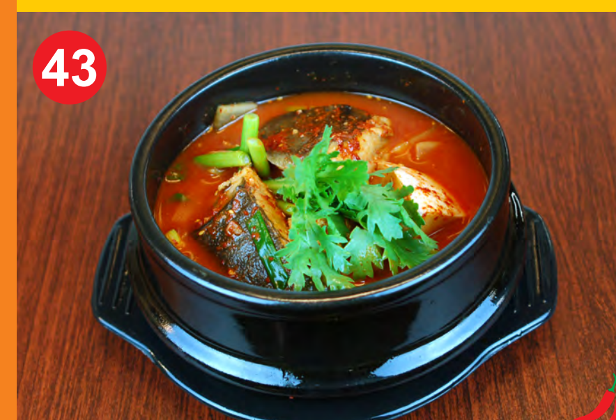
43 KWANGEO MAEWOONTANG 광어매운탕