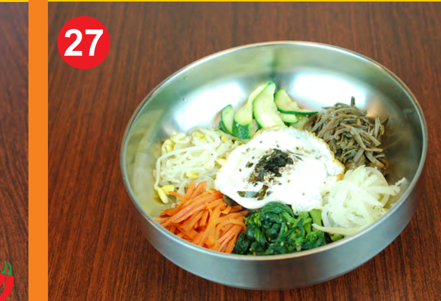
27 BIBIMBAP 비빔밥