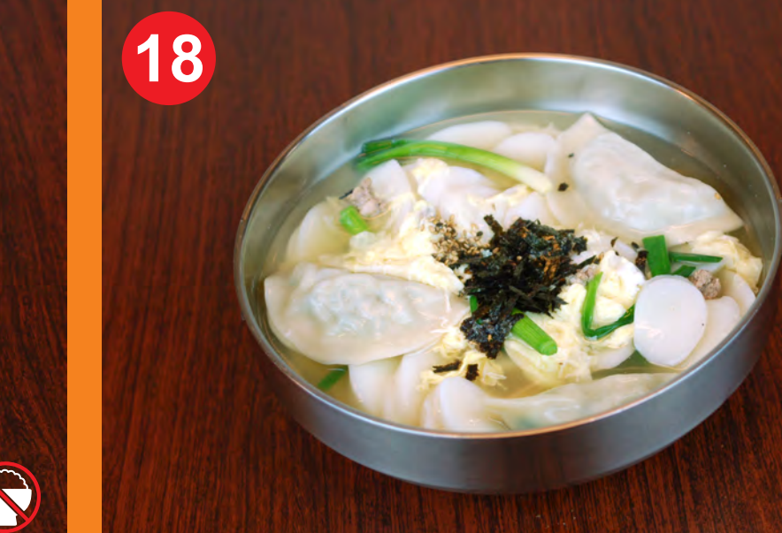
18 DDUK MANDU GUK 떡만두국