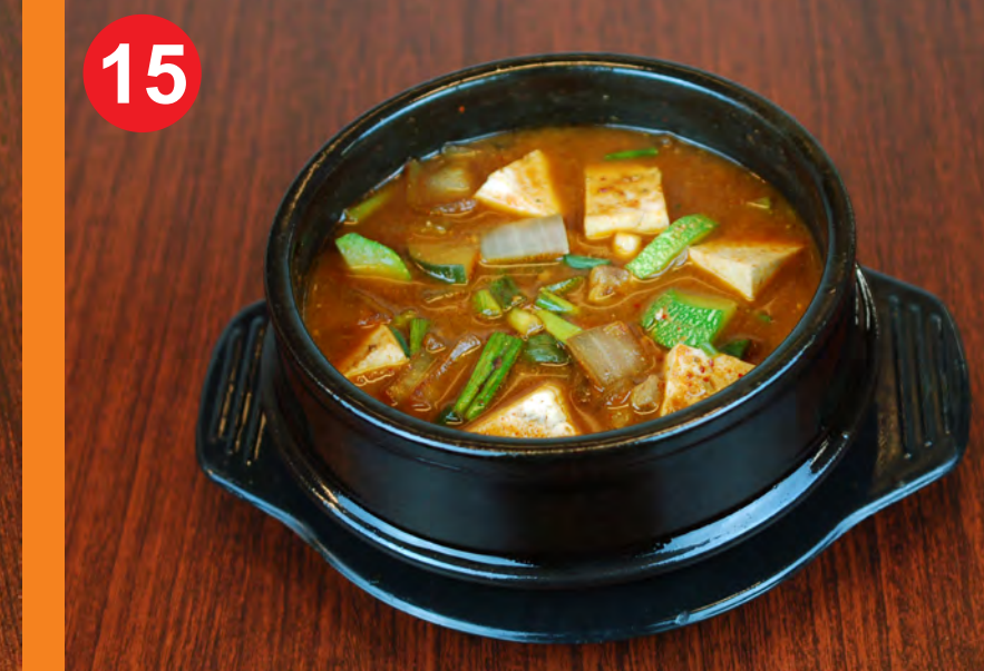
15 DWENJANG JJIGAE 된장찌개