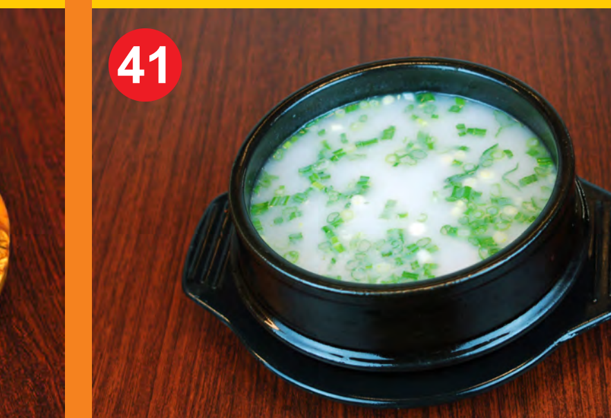
41 GOMTANG 골탕