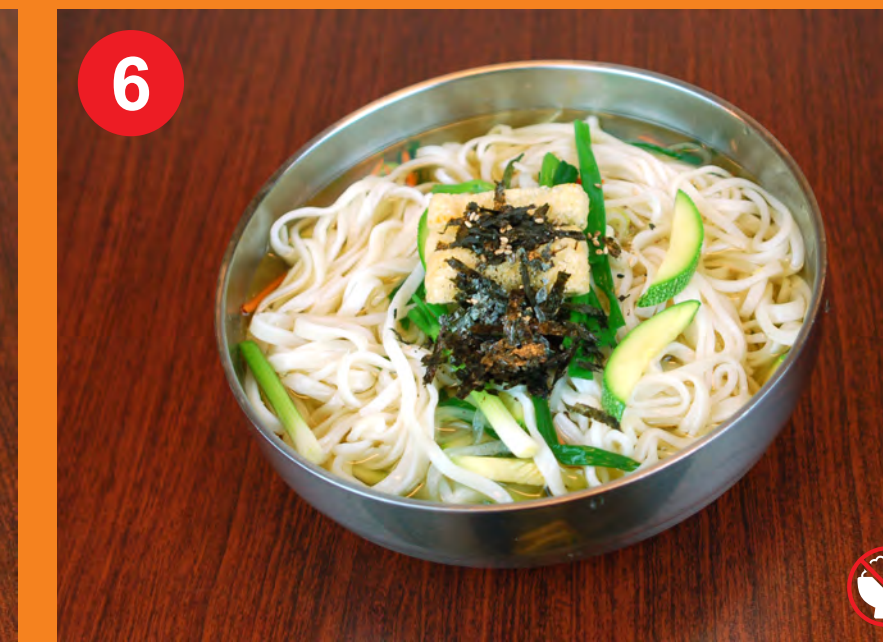
6 KAL-GUKSU 칼국수