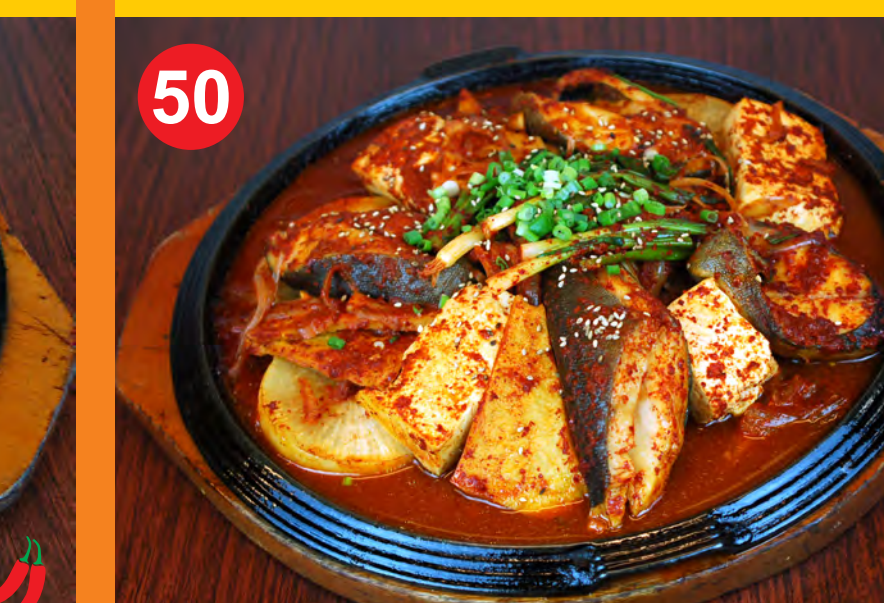
50 EUNDAEGU JORIM 은대구조림