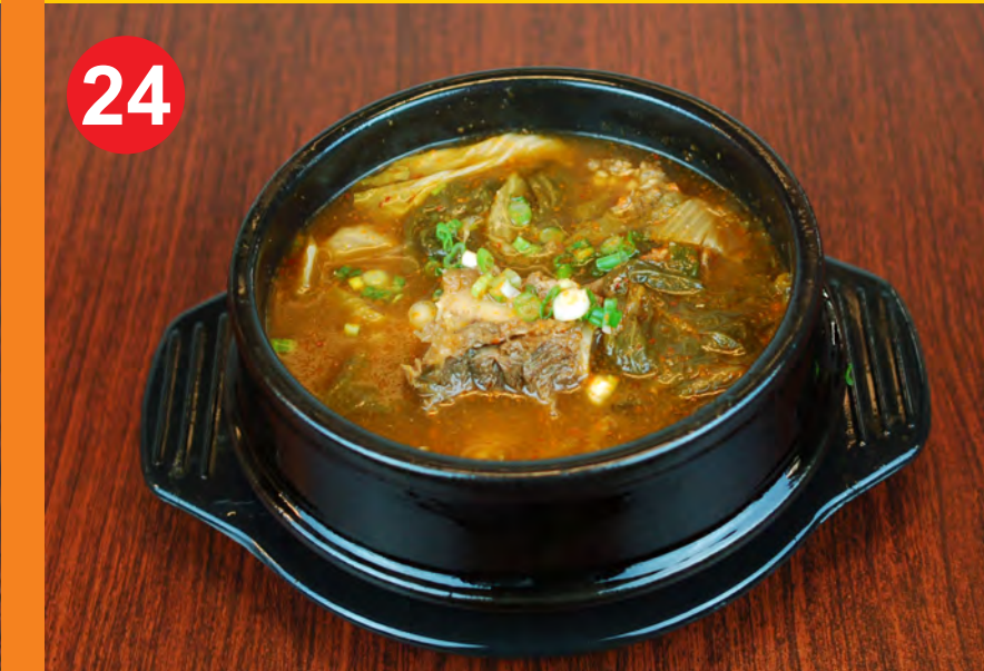
24 UGEJI GALBI TANG 우거지갈비탕