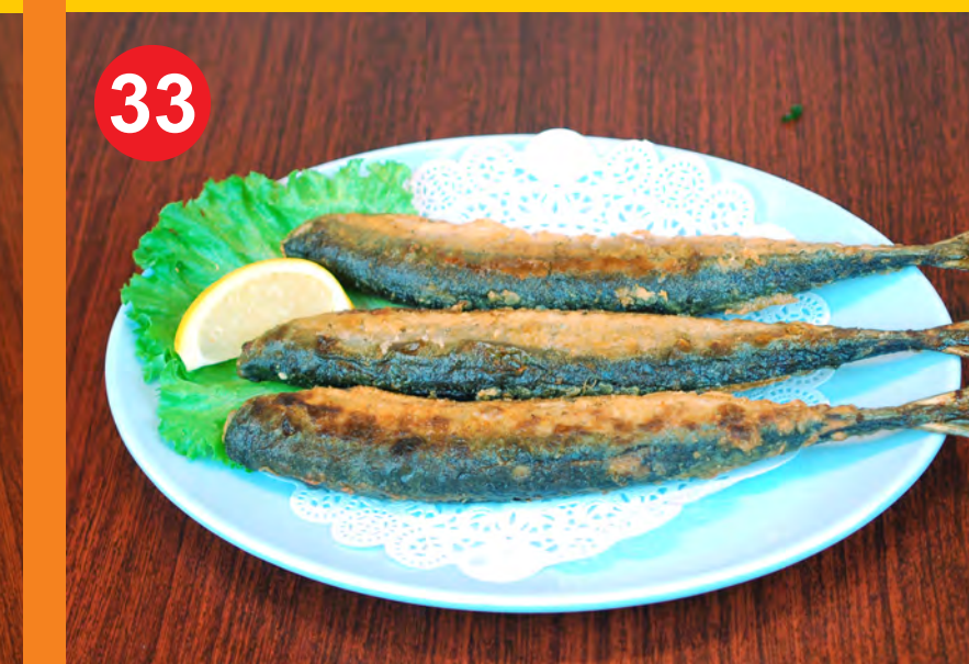
33 GGONGCHI 궁치