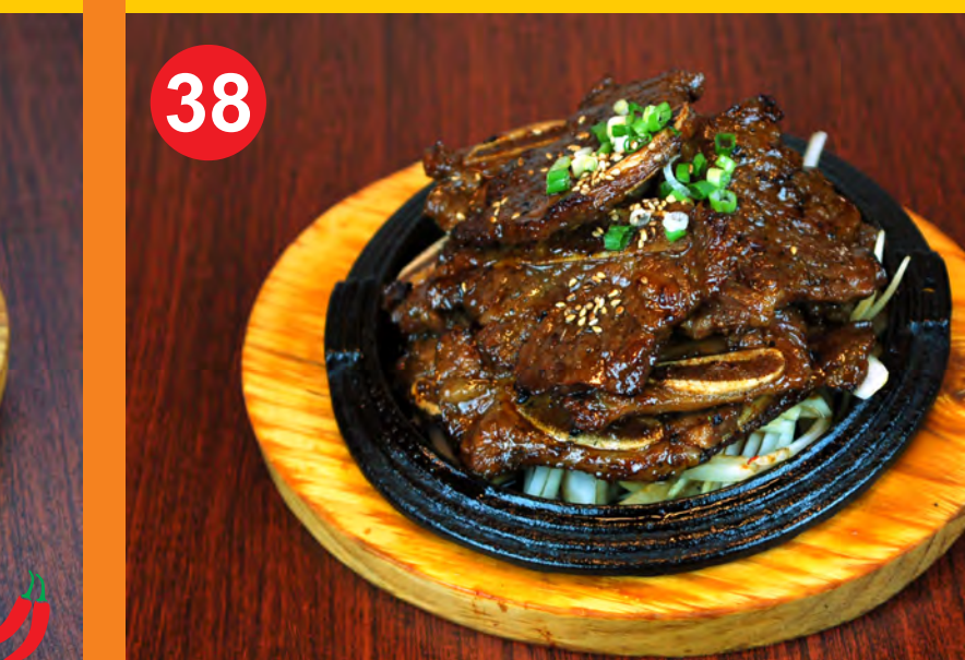
38 GALBI 갈비