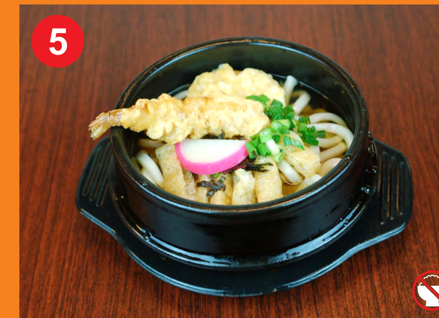
5 TEMPURA UDON 덴푸라우동