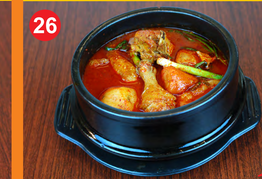
26 DAK-DORI TANG 닭도리탕