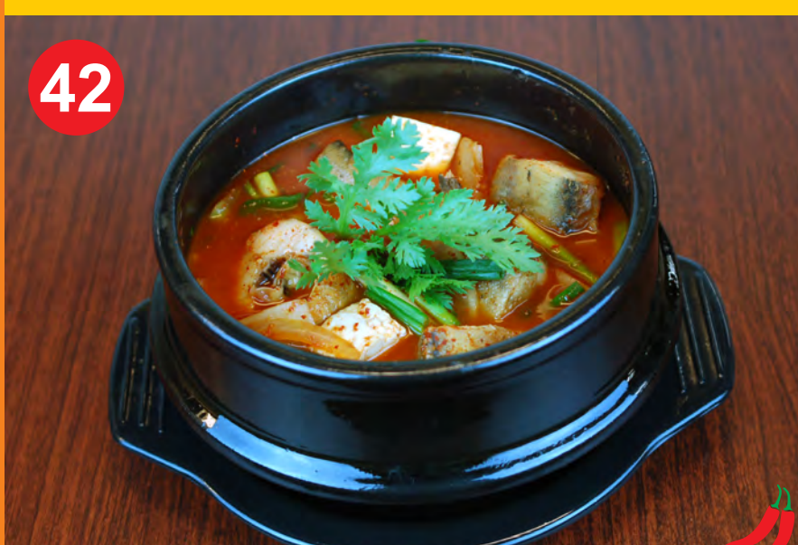
42 DONGTAE MAEWOONTANG 동태매운탕