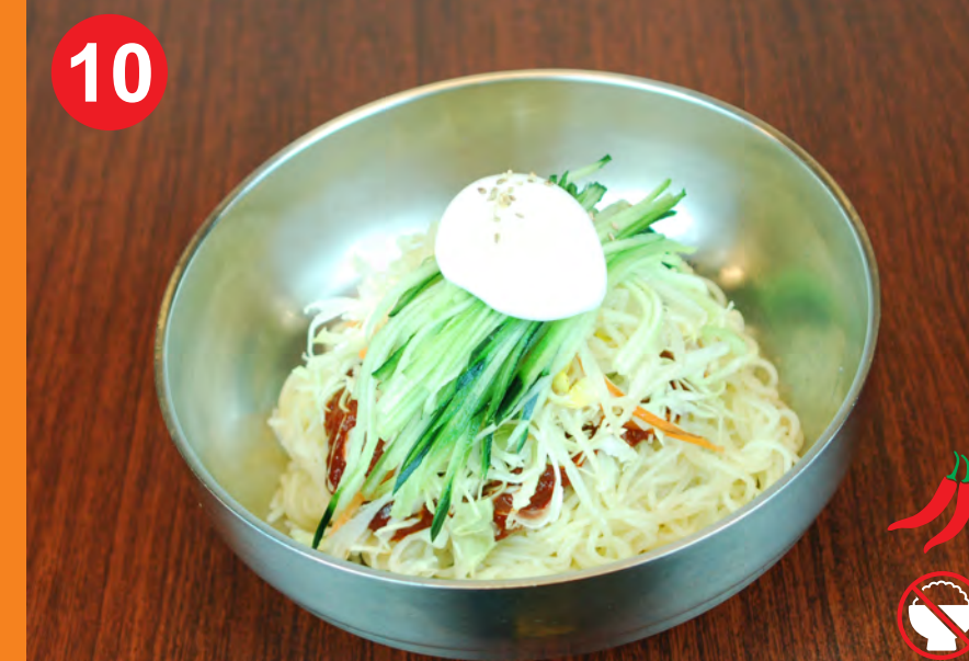
10 JJOL-MYUN 쫄면