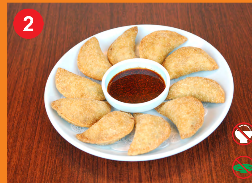
2 KUN MANDU 군만두