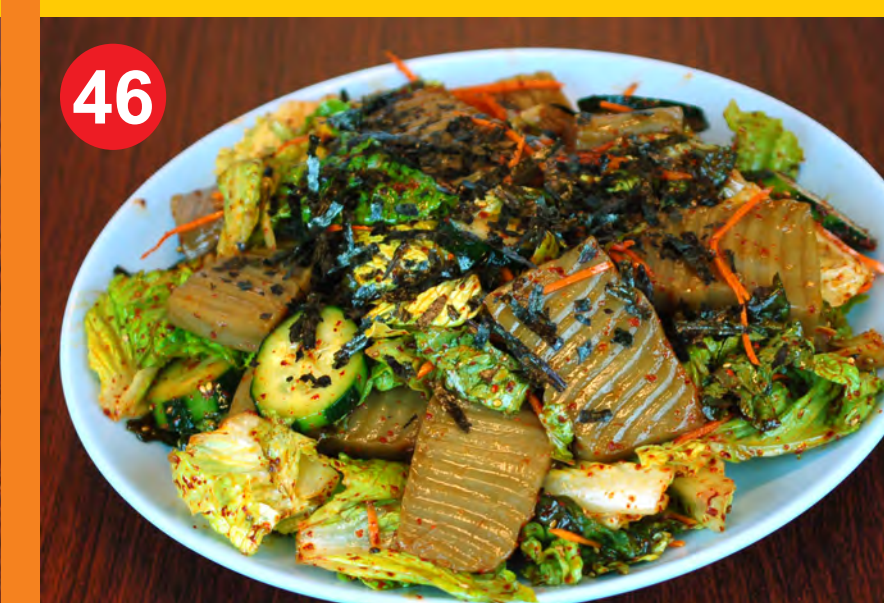
46 DOTORIMUK MUCHIM 도토리묵무침