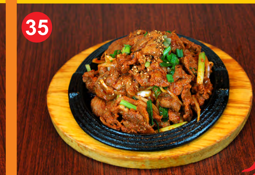
35 DWAEJI BULGOGI 돼지불고기