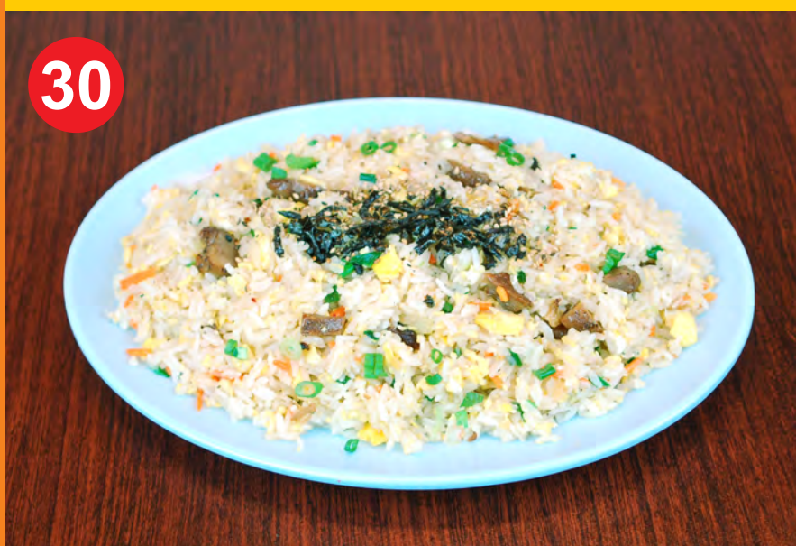
30 BOKKEUM BAP 볶음밥