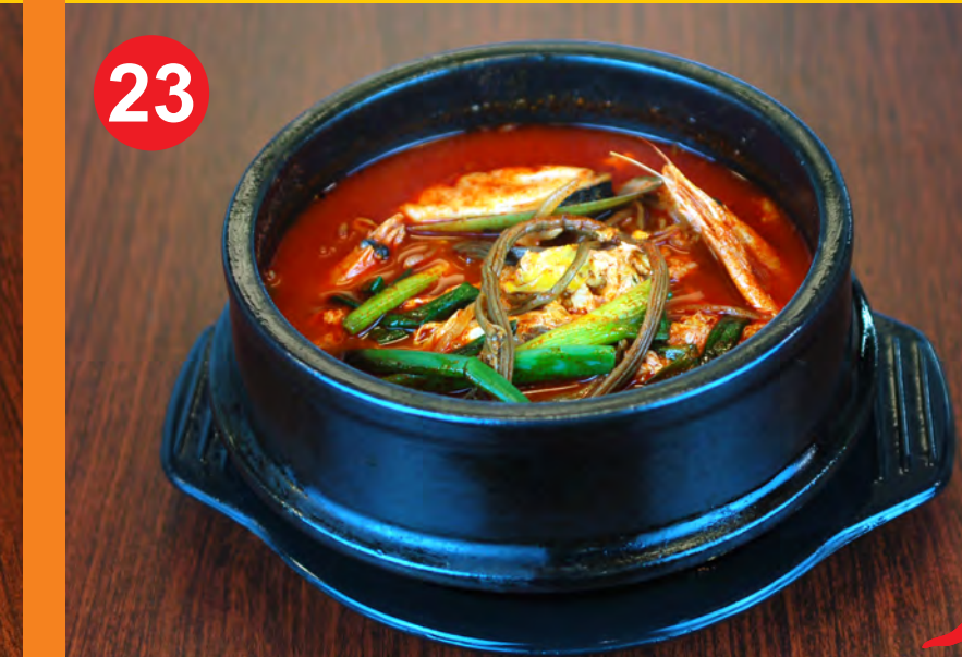
23 HAEMUL YUKGAEJANG 해물육개장