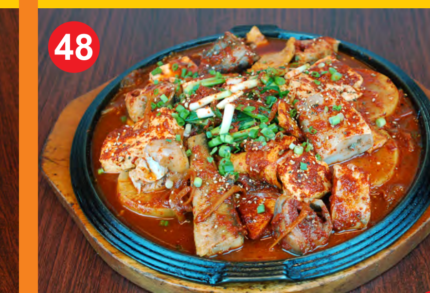
48 DONGTAE JORIM 동태조림