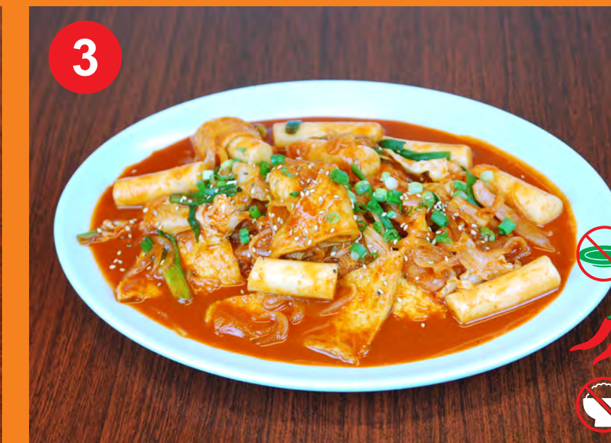
3 TTEOKBOKKI 떡볶이