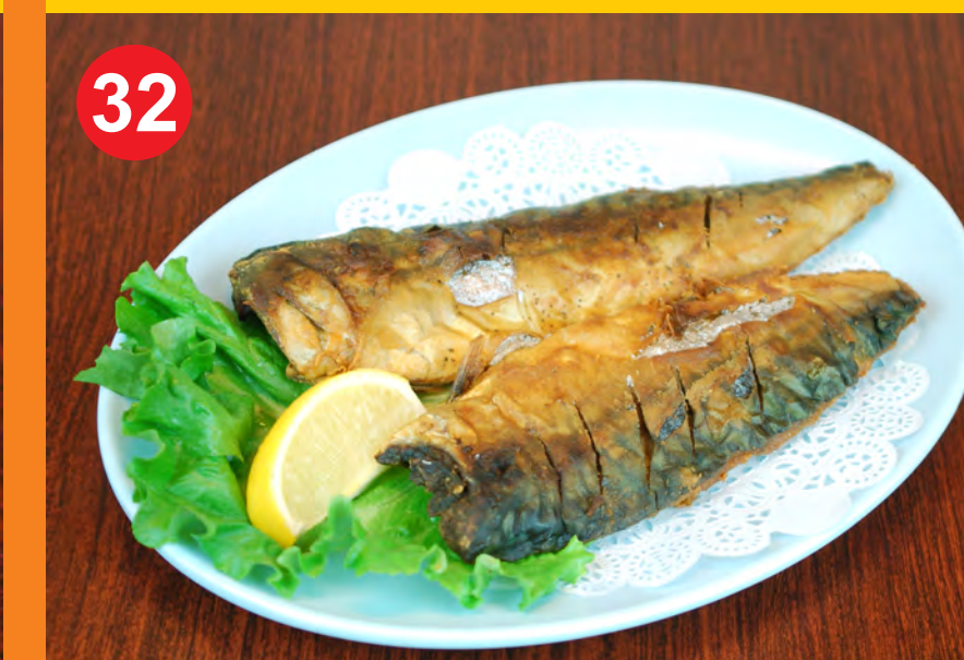
32 GODEUNGEO 고통어