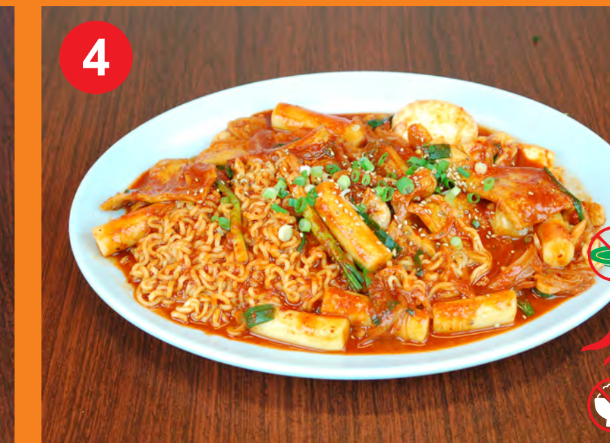
4 RABOKKI 라볶이