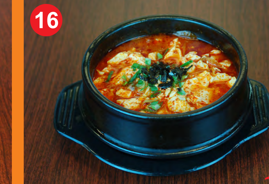
16 SOONTOFU JJIGAE 순두부찌개