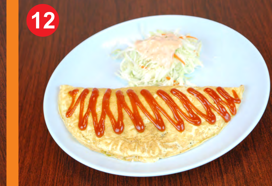
12 OMURICE 오무라이스