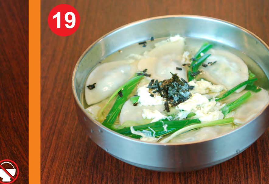
19 MANDU GUK 만두국